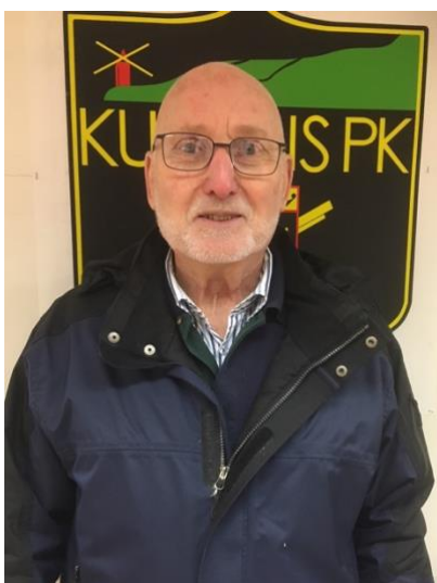
Caj Swärdh Kullens Pk