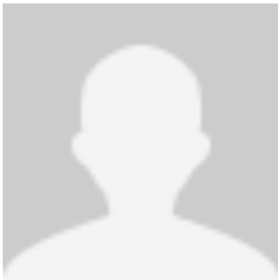
Leif Hiljeström Malmö Pk

KM- Fält A-vapen KM-PPC SSA KM-PPC ODR2,75 KM-PPC SP5