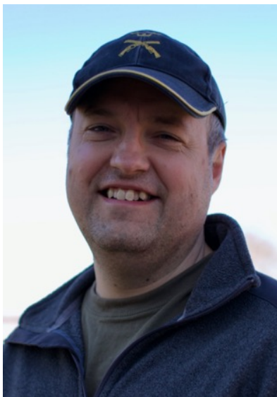
Dan Hovang Torna Hällestad's Psk